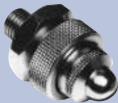
B. - S.