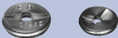
5/8 - 18 - Filetti per 1 pollice One-inch threads - Filets pour 1 pouce Gewinde für 1 Zoll - Racor 1"