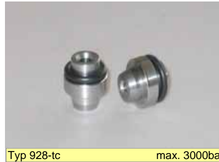
Typ 928-tc max. 3000bar